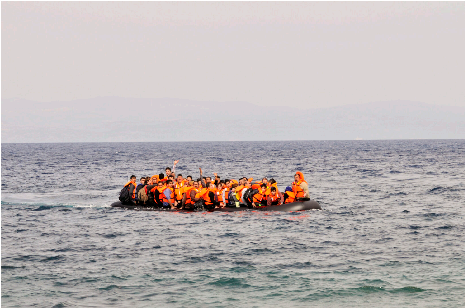
El drama dels refugiats assota Europa. A la imatge, refugiats sirians, afganesos i africans arribant a Lesbos Després d'haver partit de Turquia. Abril del 2016.