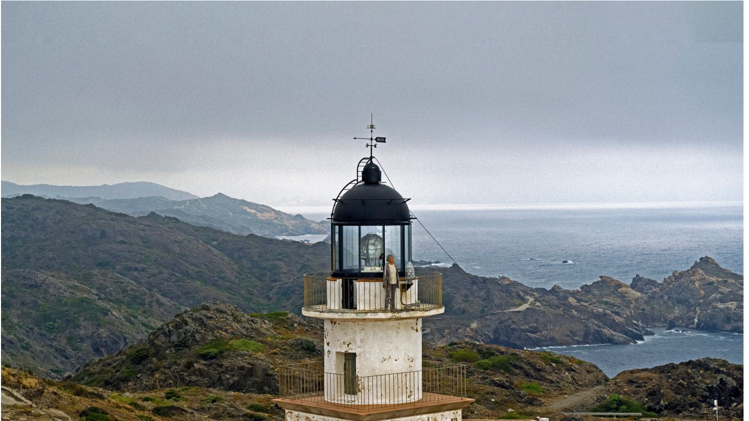
Elvira Pujol en la llanterna del faro del cabo de Creus.