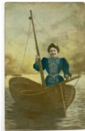
Image extraite de l'exposition « Get on board. Portraits in the minute » du Musée maritime de Barcelone.