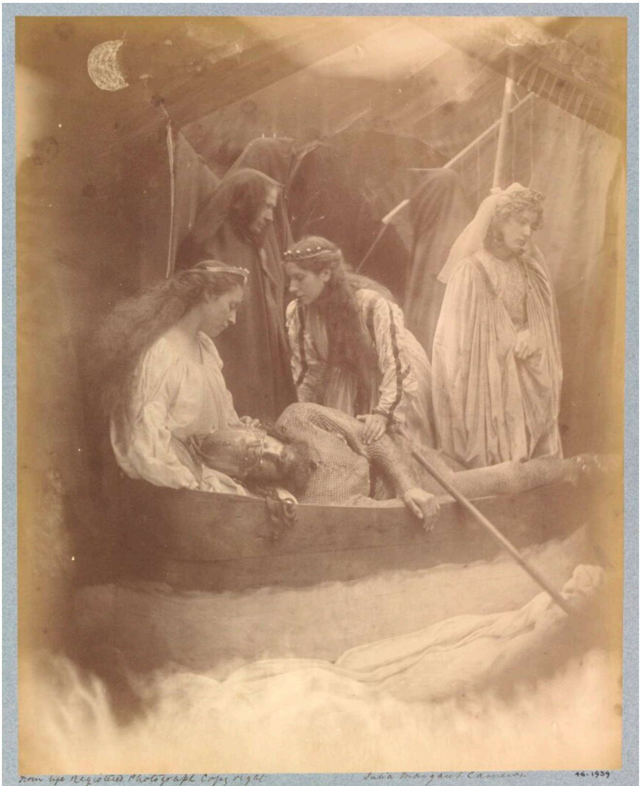
(Figure 1) Julia Margaret Cameron, La Mort du roi Arthur, 1875.

Cameron travaillait avec des appareils photo, des optiques et des techniques qui ne lui permettaient pas de figer le mouvement. Elle utilisait des négatifs sur plaques de verre avec du collodion humide ; à partir de ces négatifs, et par contact, elle réalisait des positifs sur papier albuminé. Le temps d'exposition était d'environ 10 à 12 secondes en bonne lumière, ce qui n'était pas toujours le cas à Londres ou sur l'île de Wight. Tout cela impliquait que si une personne ou un objet bougeait pendant l'ouverture de l'obturateur, cela apparaissait flou sur le négatif, ruinant la photographie. C'est pourquoi, dans les deux photographies mentionnées, Cameron a utilisé des tissus qui donnaient l'impression du mouvement de l'eau s'élevant le