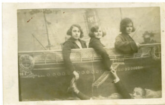
Image extraite de l'exposition « Get on board. Portraits in the minute » du Musée maritime de Barcelone.