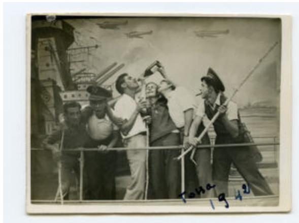
Image extraite de l'exposition « Get on board. Portraits in the minute » du Musée maritime de Barcelone.