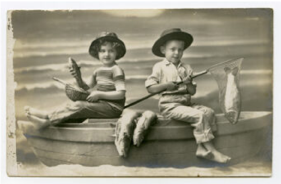
Photographie anonyme. Enfants pêchant, Barcelone.

Très peu de photographes à la minute ont survécu, mais ces dernières années – et avec l'immatérialisation de la photographie – le besoin de toucher à nouveau les photos, de leur donner un corps physique, de les tenir entre ses mains ou de les conserver ailleurs que dans le nuage, s'est fait sentir. C'est pourquoi, à l'instar des tirages au collodion sur verre et métal, des papiers albuminés et salés, des cyanotypes, des négatifs sur papier, des daguerréotypes ou des bromolys, on assiste à une renaissance de la photographie au format minute. Et aujourd'hui, il n'est pas rare de croiser des photographes utilisant ce format près de l'Arc de Triomf à Barcelone ou du Palau Maricel à Sitges.