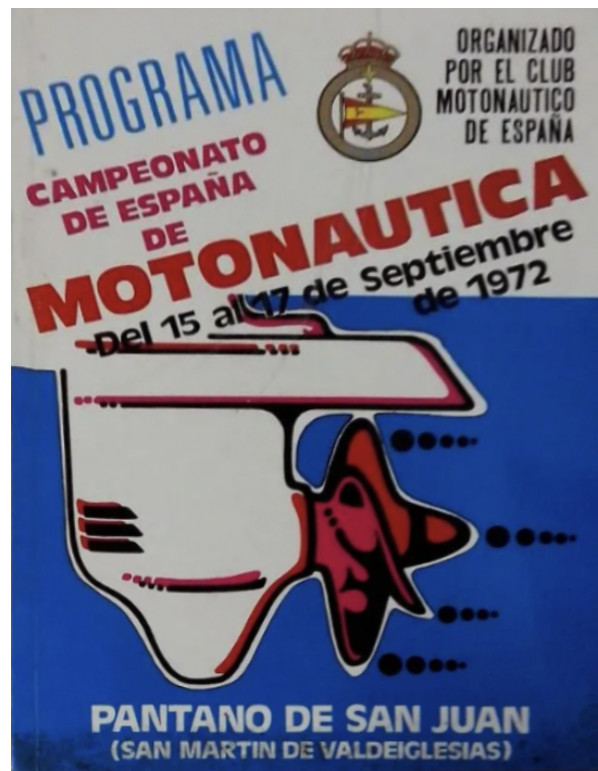
Programa del Campionat d'Espanya de Motonàutica. 1972.