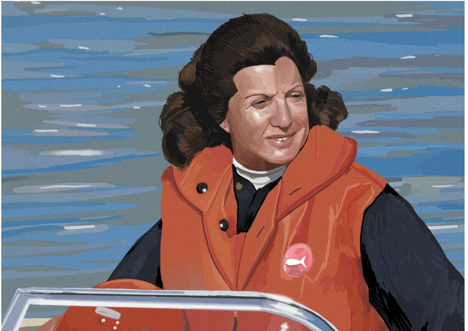
Il·lustració de Carmen Pérez Güerri. Autora: Alicia Caboblanco.