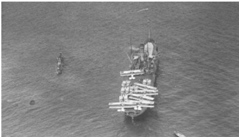
El portahidroavions Dédalo, fotografiat des d'un avió francès el 8 de setembre del 1925, a la badia d'Alhucemas.