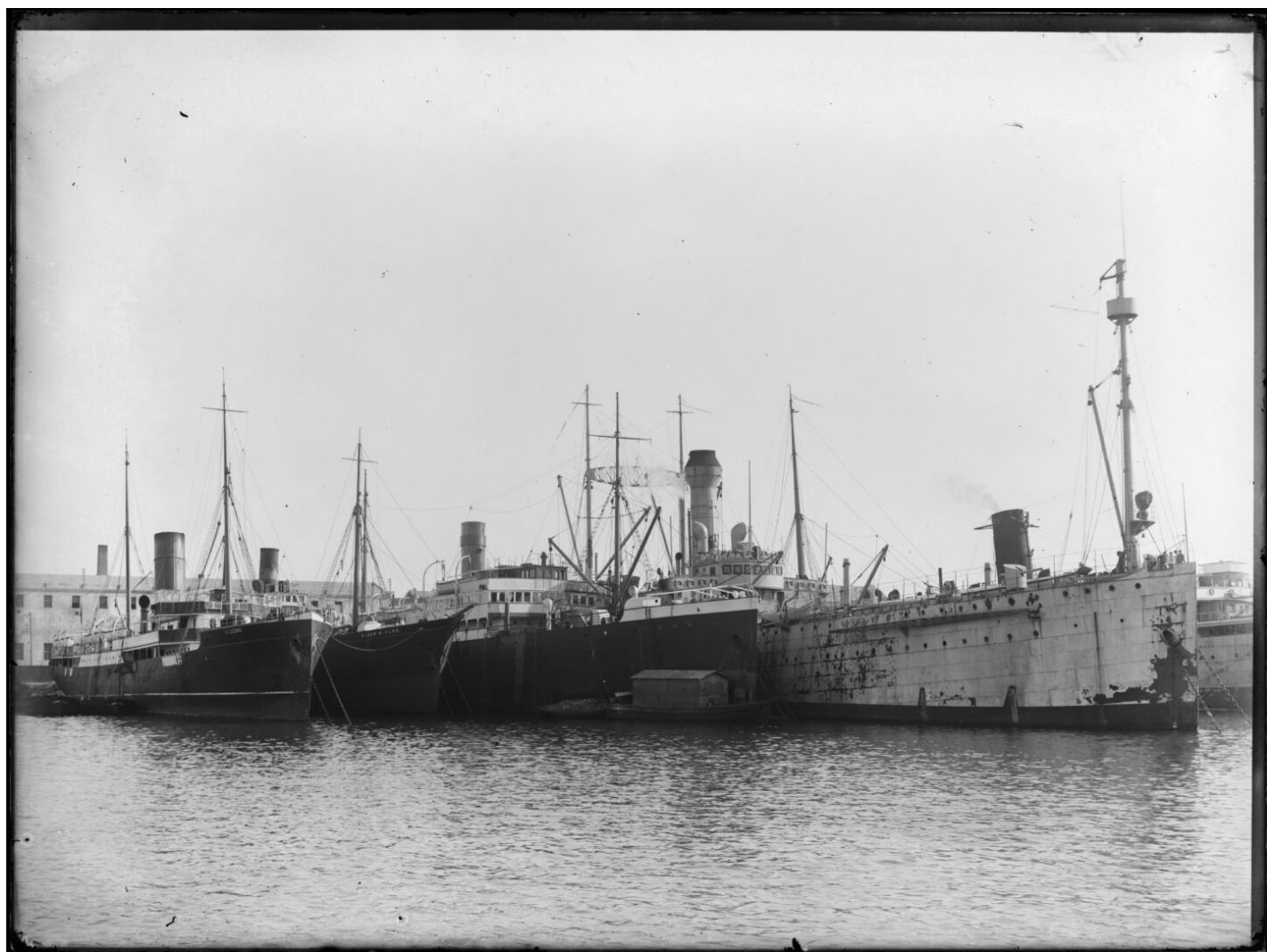
Vapors A. Lázaro, Roger de Flor i Romeu de la Cía. Trasmediterránea. A la dreta de la imatge, el portaeronaus Dédalo . 1926.