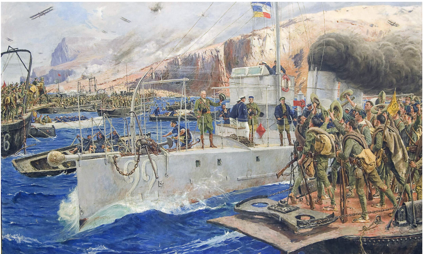
El desembarcament de l'Armada espanyola a la badia d'Alhucemas va tenir lloc el 8 de setembre del 1925, sota la direcció del general Miguel Primo de Rivera, i va suposar la fi de la guerra d'Espanya contra el Marroc. A la coberta del torpediner 22 apareixen els generals Miguel Primo de Rivera (1870-1930) i José Sanjurjo Sacanell (1872-1936), i al fons es pot veure la muntanya del Morro Nuevo. Pintura obra de José Moreno Carbonero.

Després del desastre d'Annual, l'exèrcit espanyol era incapaç de recuperar el territori perdut i de pacificar el territori. Fins i tot entre els militars, era impossible trobar un acord entre els partidaris de portar la guerra fins a l'extrem o d'abandonar definitivament la colònia. Les discussions eren molt dures i els militars arribaven a les mans entre ells, amb acusacions de covardia, traïció, etc. El general Primo de Rivera, dictador singular, era inicialment partidari d'abandonar el Marroc, i va ser acusat d'abandonista per una part de l'exèrcit. Però davant de les pressions que venien per totes bandes, i dels reiterats atacs de les cabiles dirigides per Abd el-Krim, el govern va prendre la decisió d'anar a totes. Aquest cop, l'Estat es va posar d'acord amb França, que compartia el problema als seus territoris del Marroc, i va afrontar la situació amb intel·ligència, organització i una bona preparació.